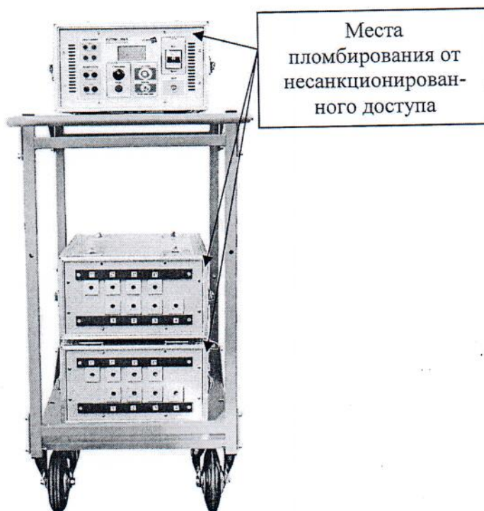
Рисунок 1 – Общий вид установок и места пломбирования от несанкционированного доступа

Для предотвращения несанкционированного доступа к внутренним частям блоков установок предусмотрены голографические наклейки. Общий вид установок и места пломбирования от несанкционированного доступа (места нанесения голографических наклеек) представлены на рисунке 1.