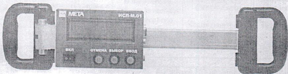
Рисунок 2. Внешний вид преобразователя измерительного угла поворота ИСЛ-М.01