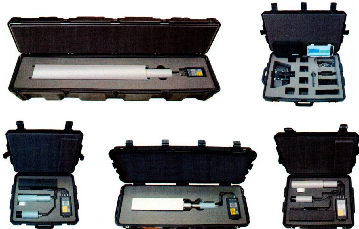
Рисунок 1 – Общий вид основных измерителей комплекса МКС-АТ6103

Общий вид основных измерителей комплекса МКС-АТ6103 представлен на рисунке 1.