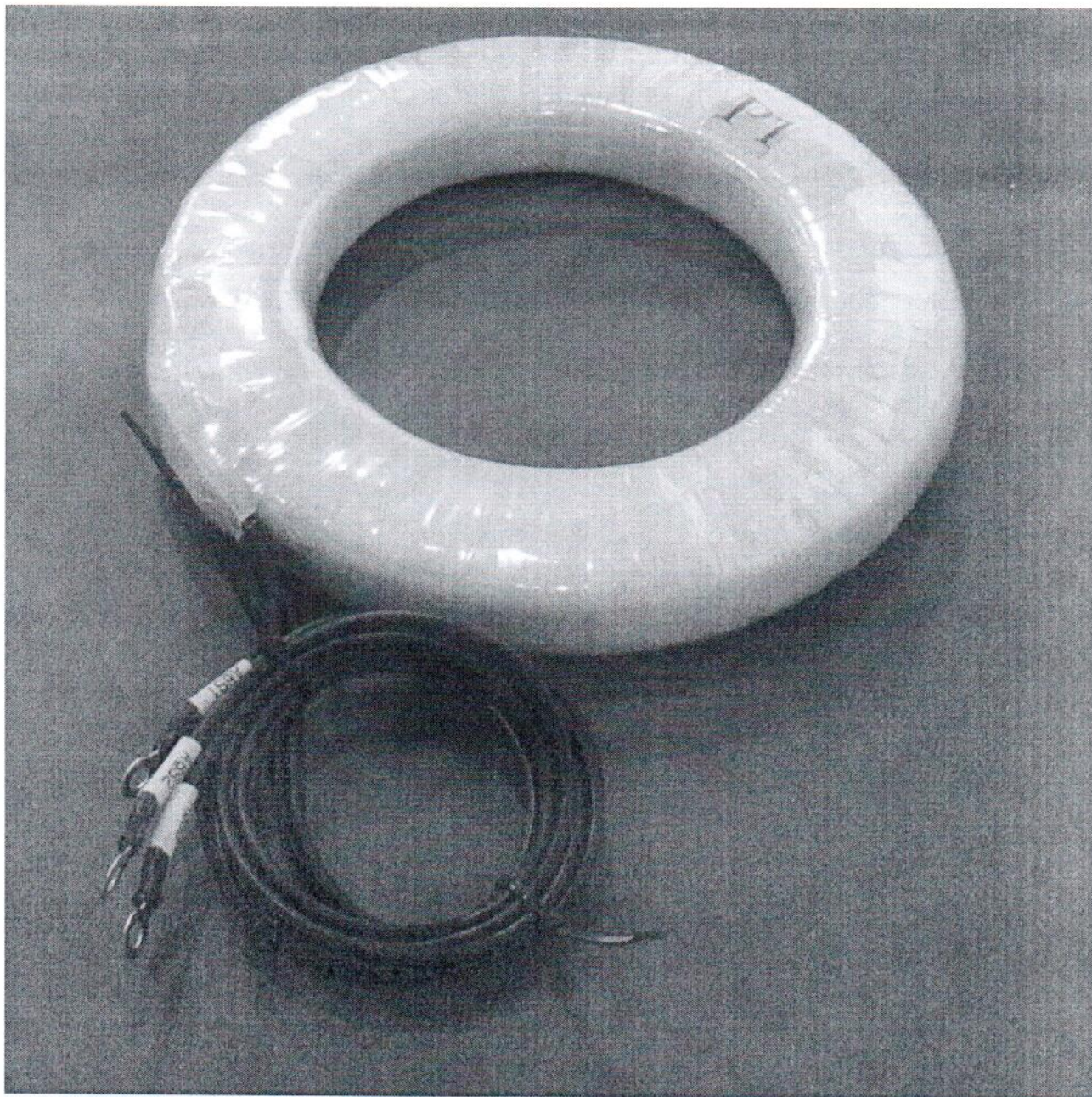
Рисунок 1 – Внешний вид трансформатора тока измерительного индуктивного LR-110 (126).

Внешний вид трансформаторов тока измерительных LR-110 (126) представлен на рисунке 1.