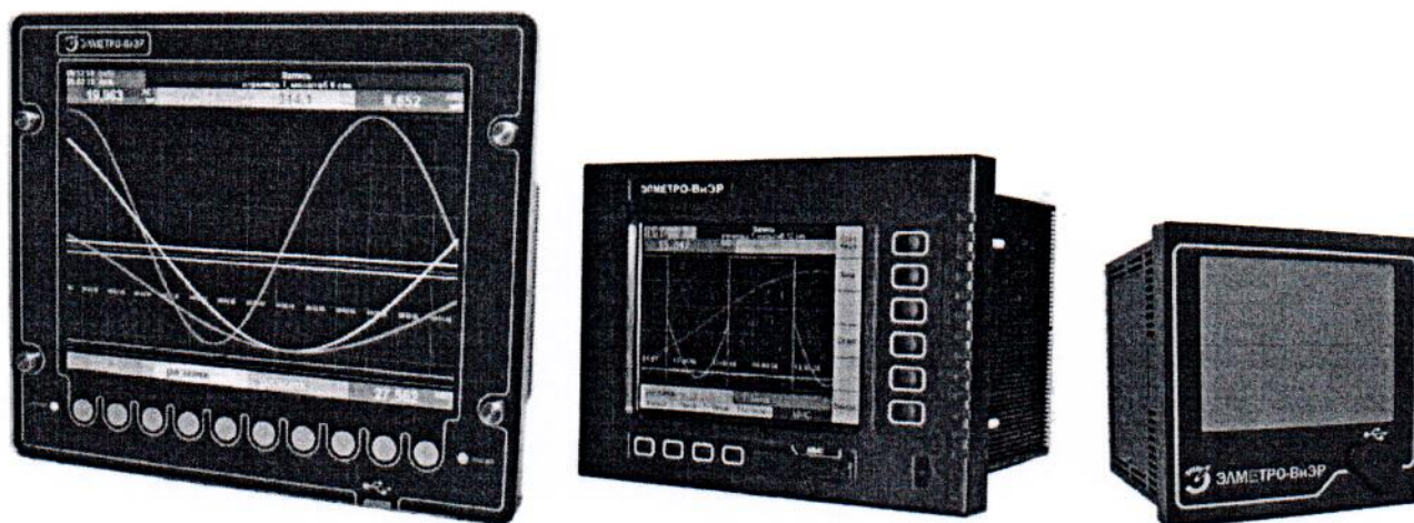
Рисунок 1 – Фотографии общего вида регистраторов

Фотографии общего вида регистраторов представлены на рисунке 1.