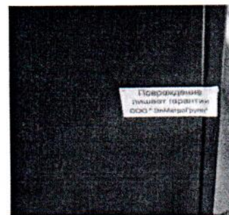
Рисунок 2 – Схема и внешний вид пломбировки регистратора от несанкционированного доступа.