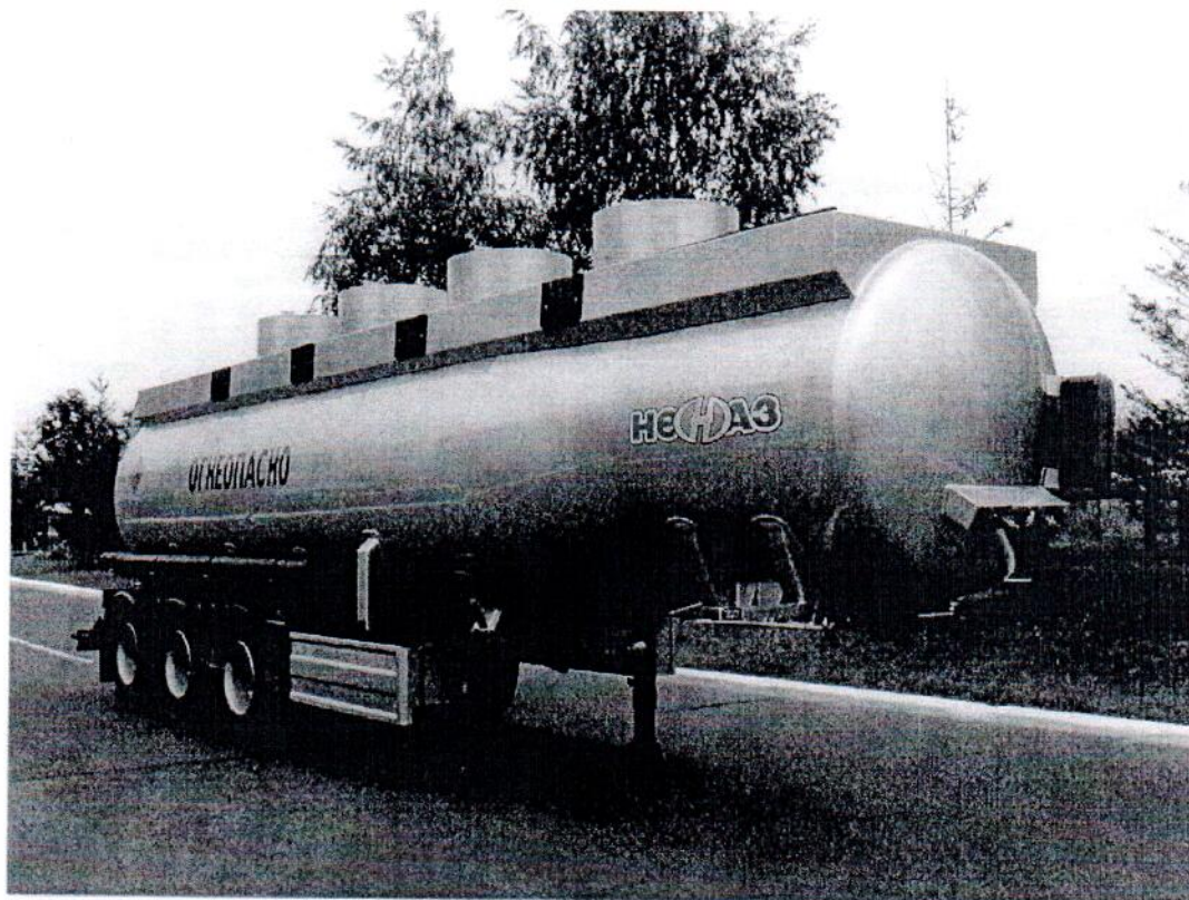
Рисунок 1- Общий вид средства измерений