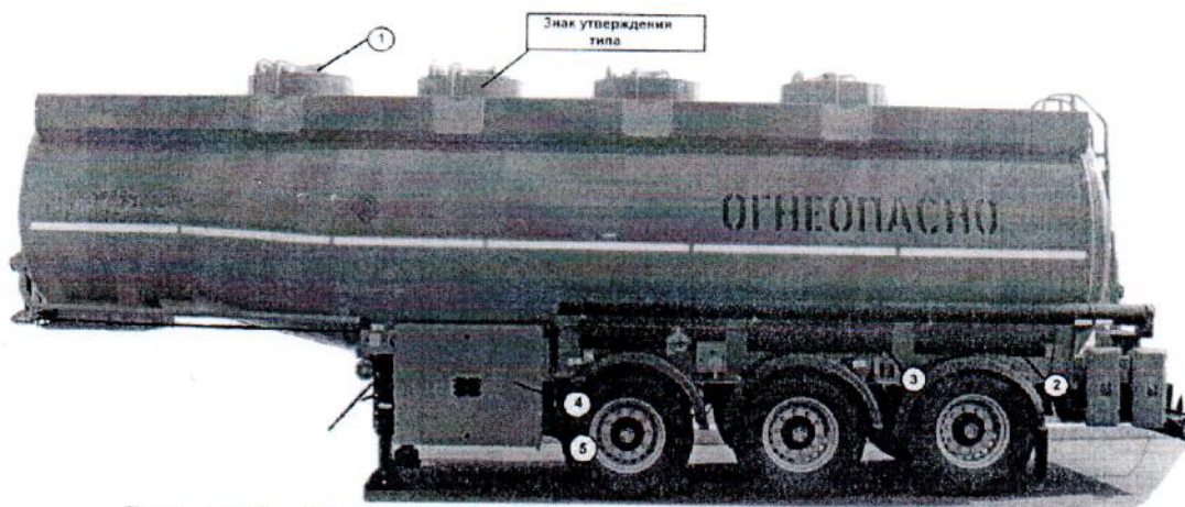
Рисунок 2 – Схема пломбировки от несанкционированного доступа