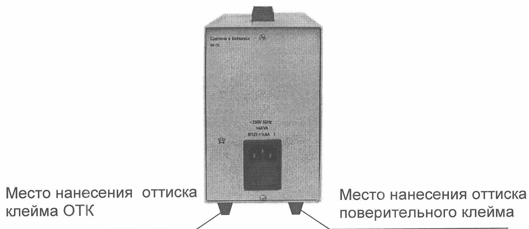
Рисунок А.1 – Место нанесения оттиска поверительного клейма и оттиска клейма ОТК (вид источника питания сзади)