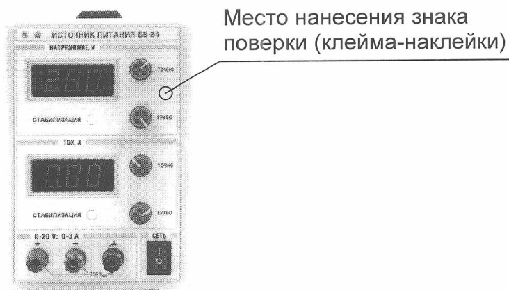
Рисунок А.2 – Место нанесения знака поверки (клеймо-наклейка) (вид источника питания спереди)