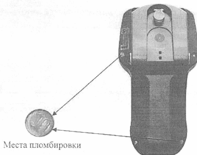
Рисунок 2 – Места пломбировки корпуса дефектоскопа

На рисунке 2 показано место пломбировки корпуса дефектоскопа для предотвращения несанкционированного доступа.