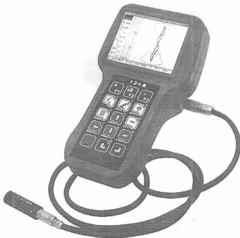
Рисунок 1 - Внешний вид дефектоскопа вихретокового ВД 3-81