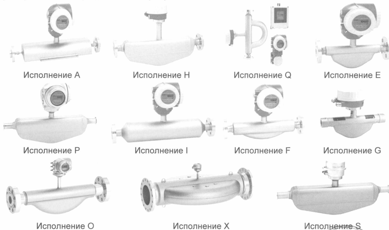
Рисунок 1 - Внешний вид расходомеров кориолисовых массовых PROMASS

Внешний вид расходомеров в зависимости от исполнения первичного преобразователя представлен на рисунке 1.