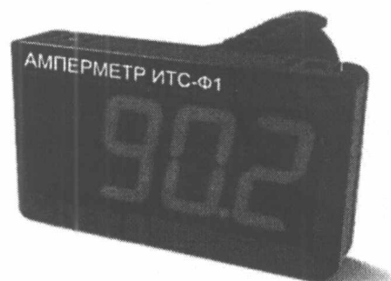
Общий вид приборов в корпусе Щ9 Рисунок 2

Приборы изготавливаются в нескольких вариантах исполнений, отличающихся друг от друга конструкцией корпуса и напряжением питания.