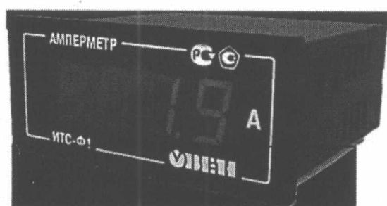
Общий вид приборов в корпусе Щ3 Рисунок 1

Фотографии общего вида приборов приведены на рисунках 1 и 2.