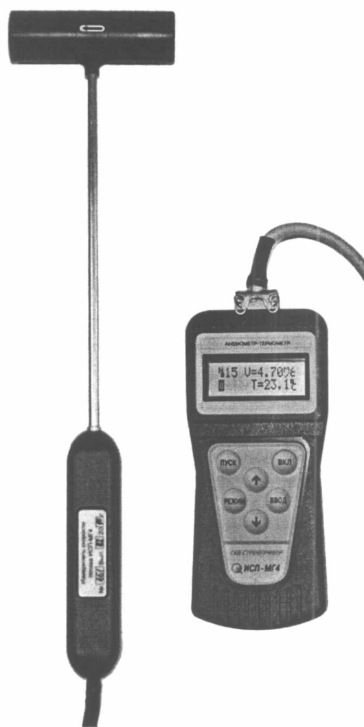
Рисунок 1 – Внешний вид анемометра-термометра цифрового ИСП-МГ4