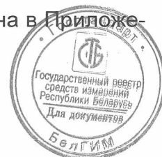
Схема пломбировки газоанализатора от несанкционированного доступа с указанием мест для нанесения знака поверки в виде клейма-наклейки приведена в Приложении А к описанию типа