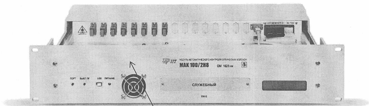
Схема с указанием мест нанесения знака поверки

Место нанесения знака поверки в виде клейма-наклейки