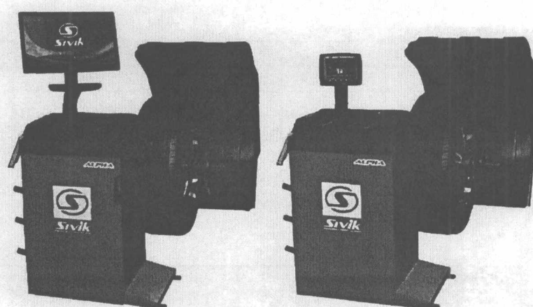
Рисунок 3 - Станок балансировочный СБМП-40