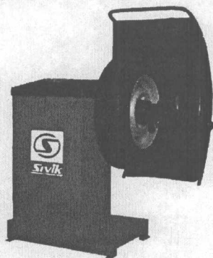
Рисунок 1 - Станок балансировочный СБР-40

Внешний вид станков приведен на рисунках 1-4.