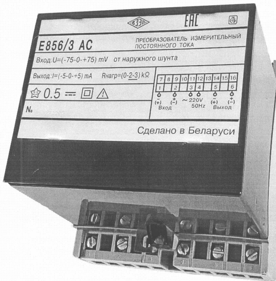
Рисунок 1.1 – Общий вид ИП

Фотографии общего вида и места для нанесения клейм приведены на рисунках 1.1 и 1.2.