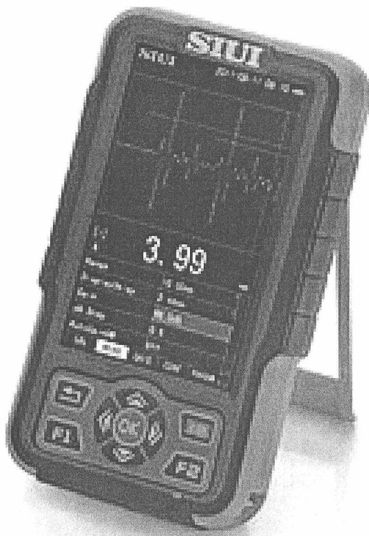
Рис. 1 Внешний вид толщиномеров

Внешний вид толщиномеров приведен на рисунке 1.