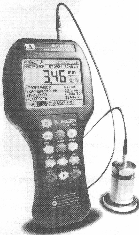
Рисунок 1 – Толщиномер электромагнитно-акустический А1270

Фотография толщиномера с подключенным ЭМА-преобразователем представлена на рисунке 1.