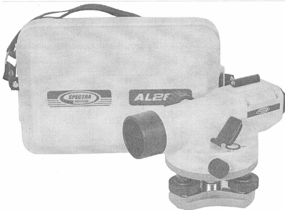
Рисунок 1 – Внешний вид нивелиров

Место нанесения знака поверки в виде клейма-наклейки приведено в Приложении А к описанию типа.