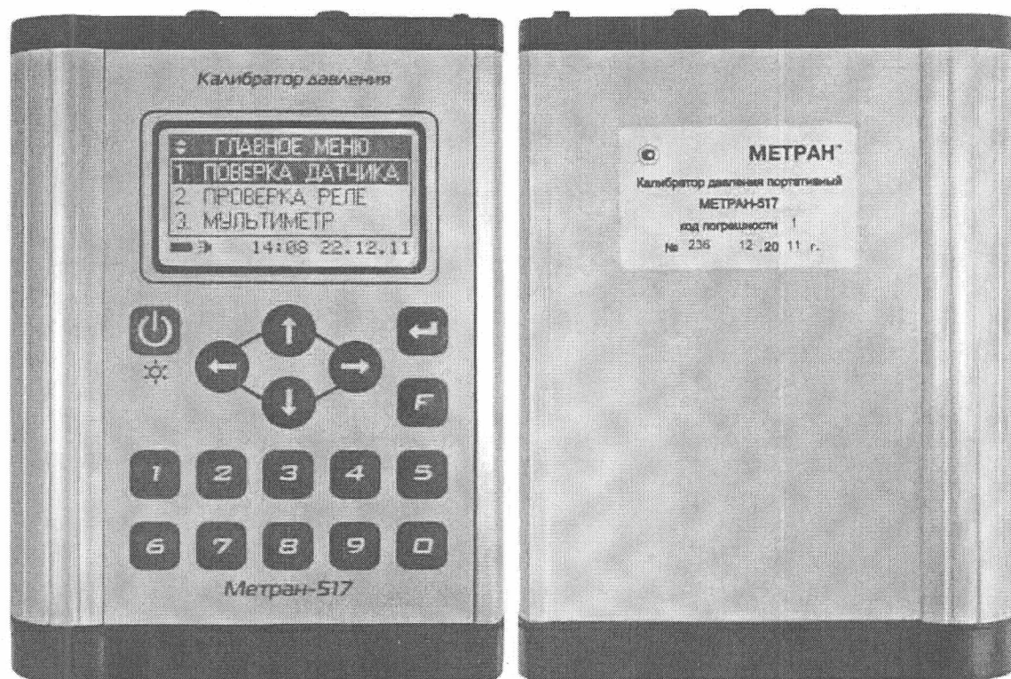
Рисунок 1 - Внешний вид калибратора Метран-517

Внешний вид калибратора представлен на рисунке 1.