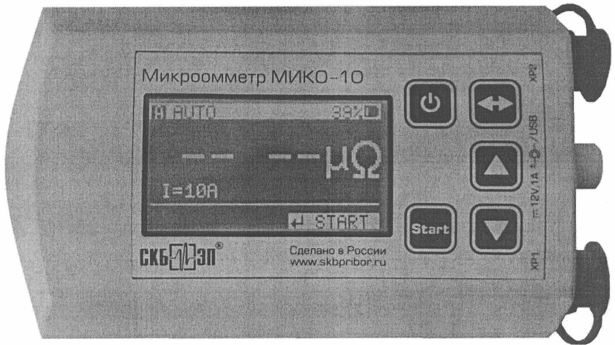
Рис. 1 Измерительный блок