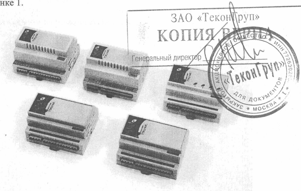
Рисунок 1 – Фотография общего вида модулей системы интеллектуальных модулей «ТЕКОНИК»

Фотография общего вида модулей системы интеллектуальных модулей «ТЕКОНИК» приведена на рисунке 1.