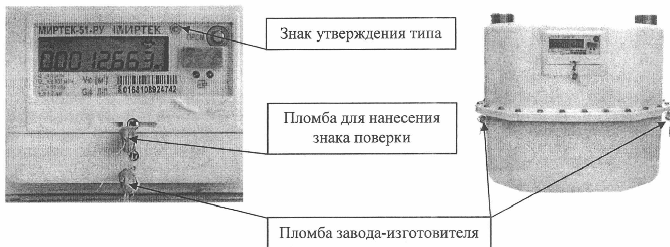
Рисунок 2 - Схема пломбировки от несанкционированного доступа, обозначение мест нанесения знака поверки, пломбы завода-изготовителя и знака утверждения типа

Схема пломбировки от несанкционированного доступа, обозначение мест нанесения знака поверки, пломбы завода-изготовителя и знака утверждения типа представлены на рисунке 2.