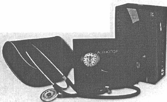
Рисунок 1 Общий вид измерителей артериального давления серии ИАД-01-«Адьютор» в исполнениях ИАД-01-1-«Адьютор», ИАД-01-1А-«Адьютор», ИАД-01-1Э-«Адьютор» ИАД-01-1Д-«Адьютор», ИАД-01-1К-«Адьютор» «Коротков»®