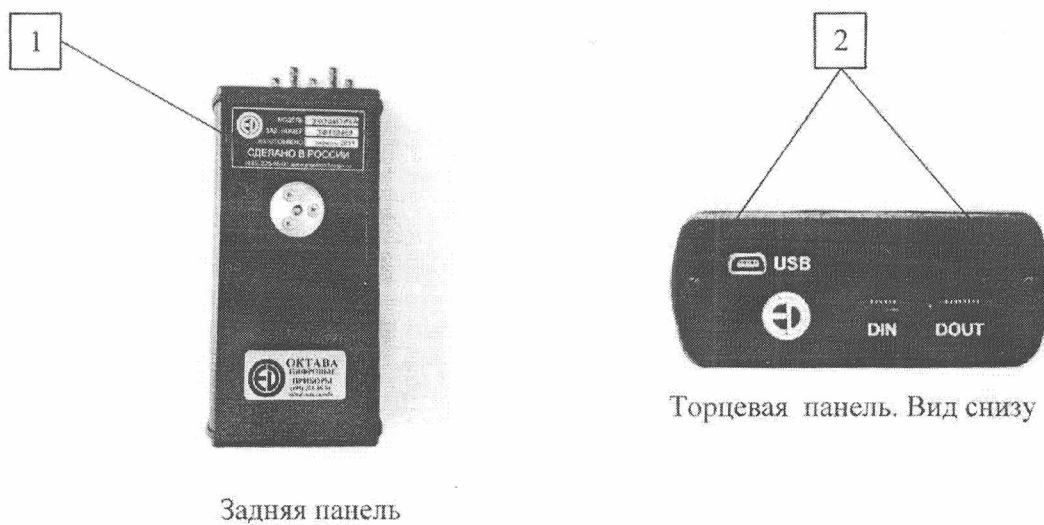
Рисунок 1 – Измеритель напряженности электрических и магнитных полей ПЗ-80