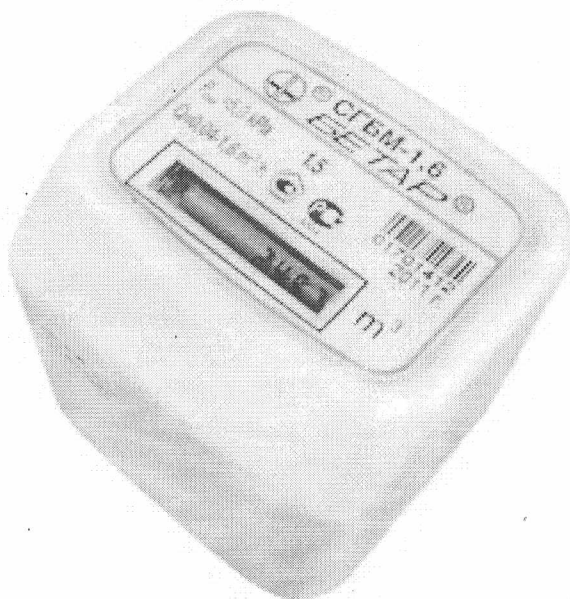
Рисунок 1 - Общий вид счетчиков газа СГБМ-1,6.

Модификация счетчика газа СГБМ-1,6 с температурной коррекцией приводит измеренный объем газа к нормальным условиям (к температуре T=20\text{ }^{\circ}\text{C} ).