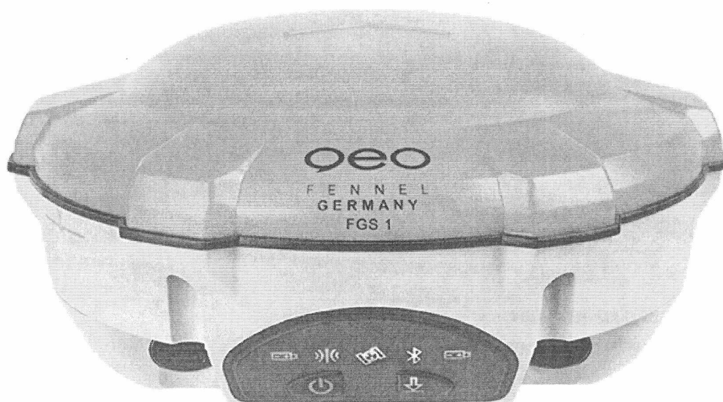
Рисунок 1 – Внешний вид GNSS-приемника FGS 1