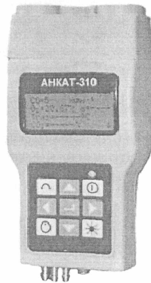
Рисунок 1 - Внешний вид газоанализаторов АНКАТ-310