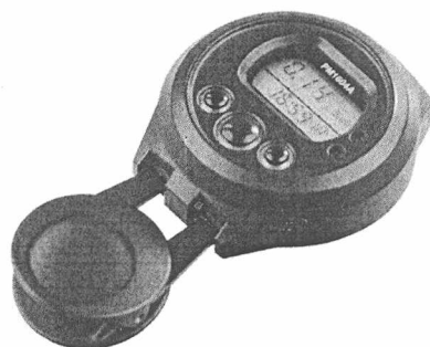
Рисунок 1 – Внешний вид прибора

Внешний вид прибора представлен на рисунке 1.