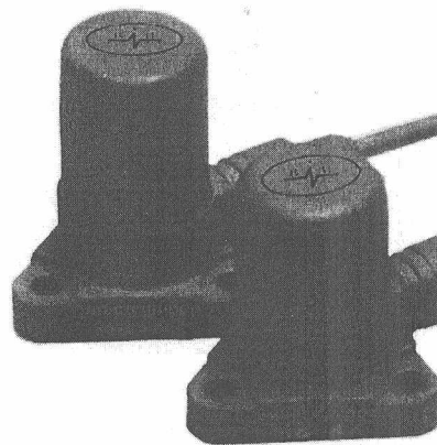
Рисунок 3 - Внешний вид преобразователей MB-43 и MB-44