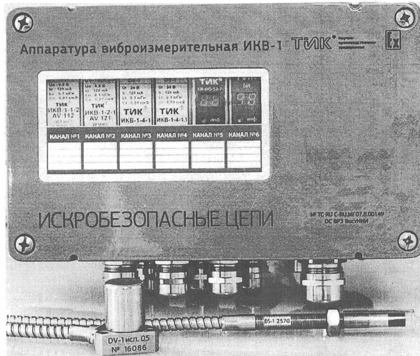
Рисунок 1 - Внешний вид аппаратуры виброизмерительной ИКВ-1