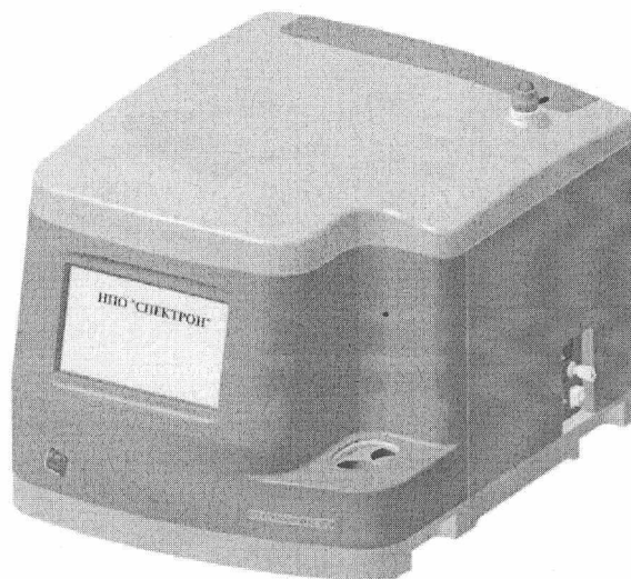
Рисунок 1 – Внешний вид СПЕКТРОСКАН МАКС-GVM

Управление прибором, обработка и вывод информации осуществляется при помощи встроенного компьютера.