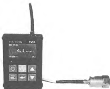
Рисунок 1 - Внешний вид виброметра «ТИК-ПИОН» (TIK-PION)

Внешний вид виброметра «ТИК-ПИОН» (TIK-PION) приведен на рисунке 1.