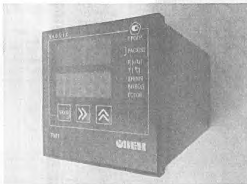
Рисунок 1 - Общий вид приборов

Фотография общего вида приборов приведена на рисунке 1.