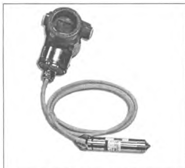
Рисунок 3 - Общий вид преобразователей ПД150 ДГ в полевом исполнении