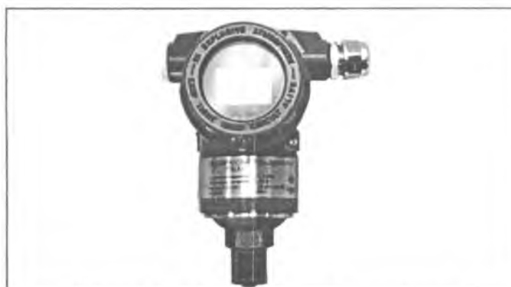
Рисунок 5 - Общий вид преобразователей ПД150 ДА (ДИ, ДВ, ДИВ) в полевом исполнении