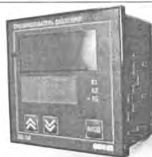
Рисунок 2 - Общий вид преобразователей ПД150 ДА (ДИ, ДВ, ДИВ, ДД) в щитовом исполнении