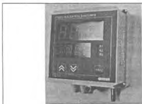
Рисунок 1 - Общий вид преобразователей ПД150 ДА (ДИ, ДВ, ДИВ) в настенном исполнении