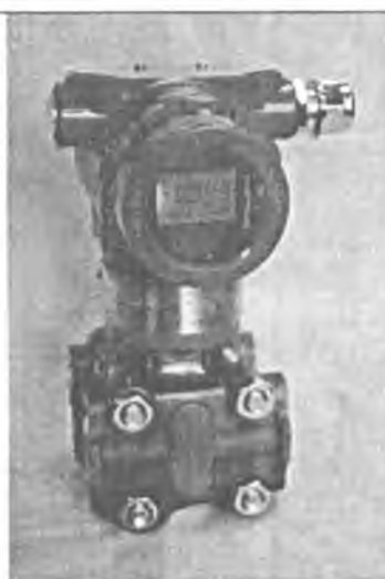
Рисунок 4 - Общий вид преобразователей ПД150 ДД в полевом исполнении