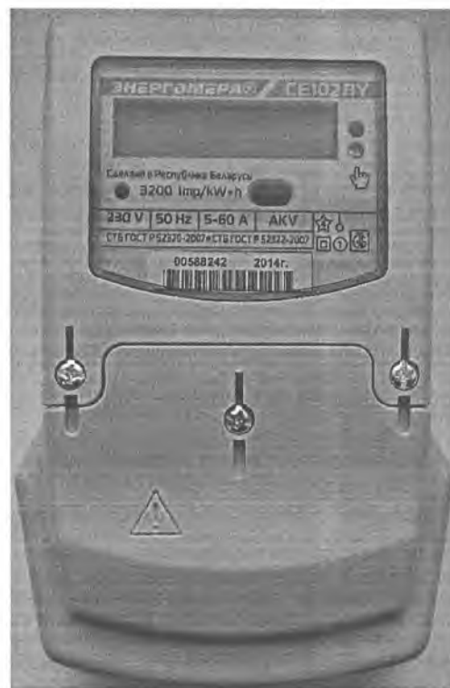
Рис. 3 Внешний вид счетчиков CE102BY корпус S6