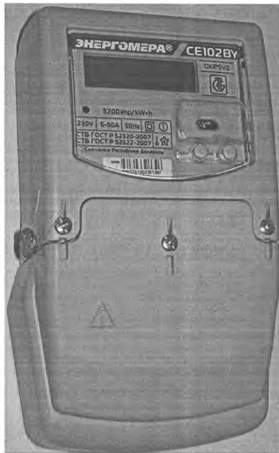
Рис. 2 Внешний вид счетчиков CE102BY корпус S7