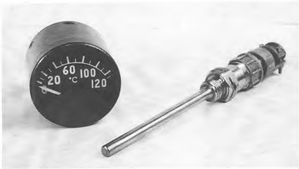
Рисунок А.1 – Общий вид термометра ТУЭ-48-Т